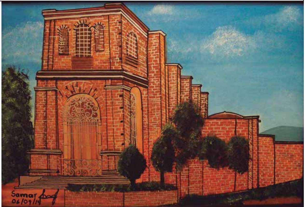
SIN TÍTULO AUTOR: SARA JIMÉNEZ SÁNCHEZ

En la Casa del Arte “Doctor Vicente Preciado Zacarías” se exponen los resultados de la clase de pintura al óleo aplicado que ofrece el maestro Emmanuel Limón Maciel en el Instituto de Formación para el Trabajo del Estado de Jalisco IDEFT