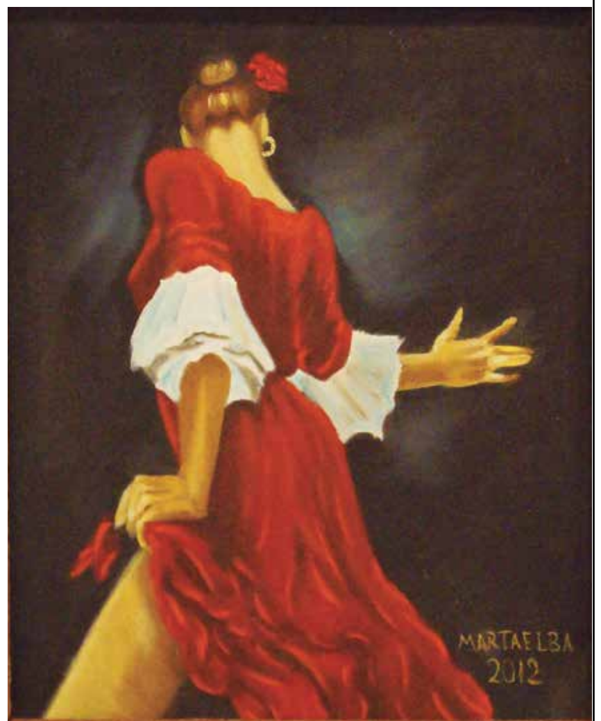
SIN TÍTULO AUTOR: MARTHA ELBA PÉREZ CALLEJA