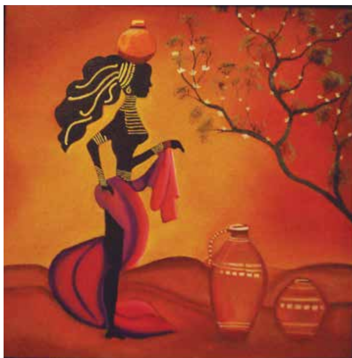
SIN TÍTULO AUTOR: TERESA TORRES VELÁZQUEZ