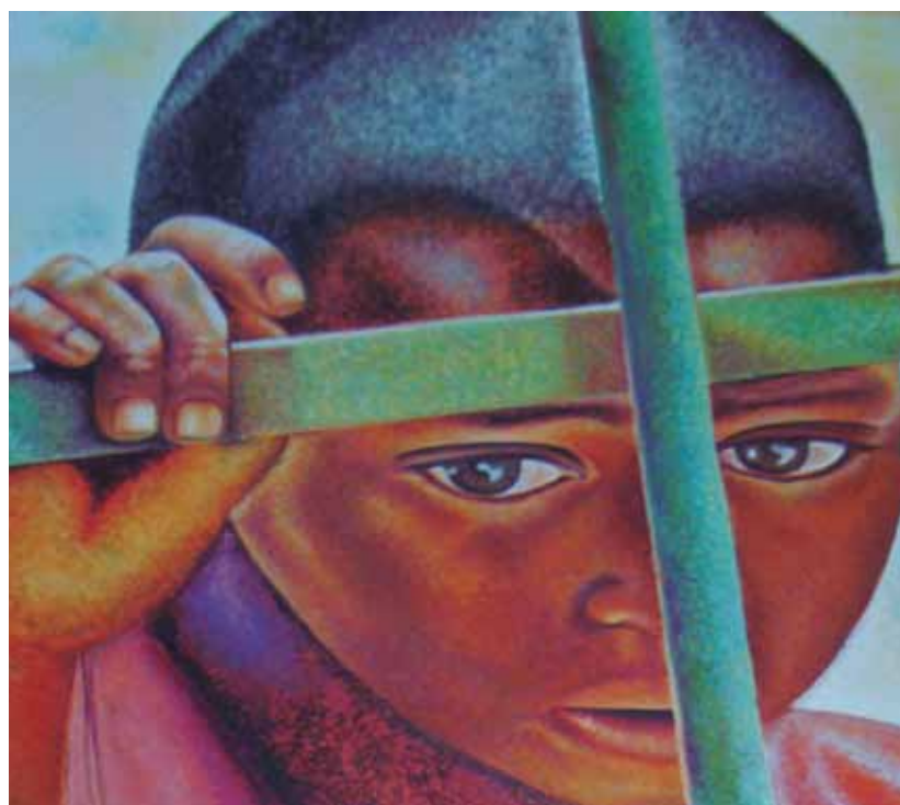
“DETALLE DE A LA ESPERA DE VÍVERES”