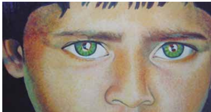
“DETALLE DE ENOJO”