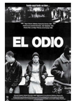
6 de junio El odio