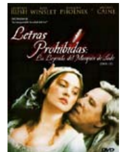
18 de abril Letras prohibidas