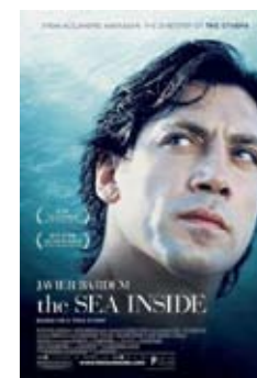
30 de mayo The sea inside