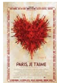
16 de mayo Paris jem t'aime