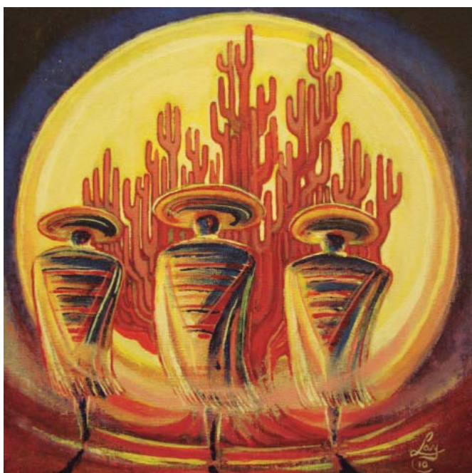
DETALLE DE “POLINO TRÍPTICO”