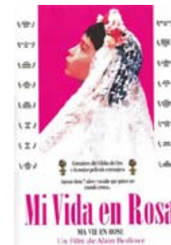
2 de mayo Mi vida en rosa