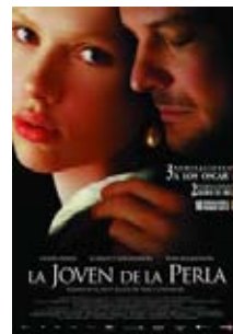
21 de marzo La joven con el arete de perla

A partir del 7 de marzo comenzó el ciclo de cine y literatura en la biblioteca del CUSur. La exhibición de las cintas se realiza todos los miércoles de 4 a 6 de la tarde en el Auditorio 1.