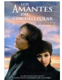
9 de mayo Los amantes del círculo polar