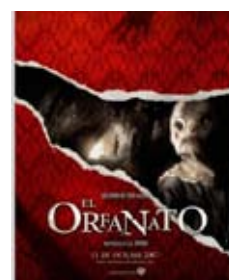
13 de junio El orfanato