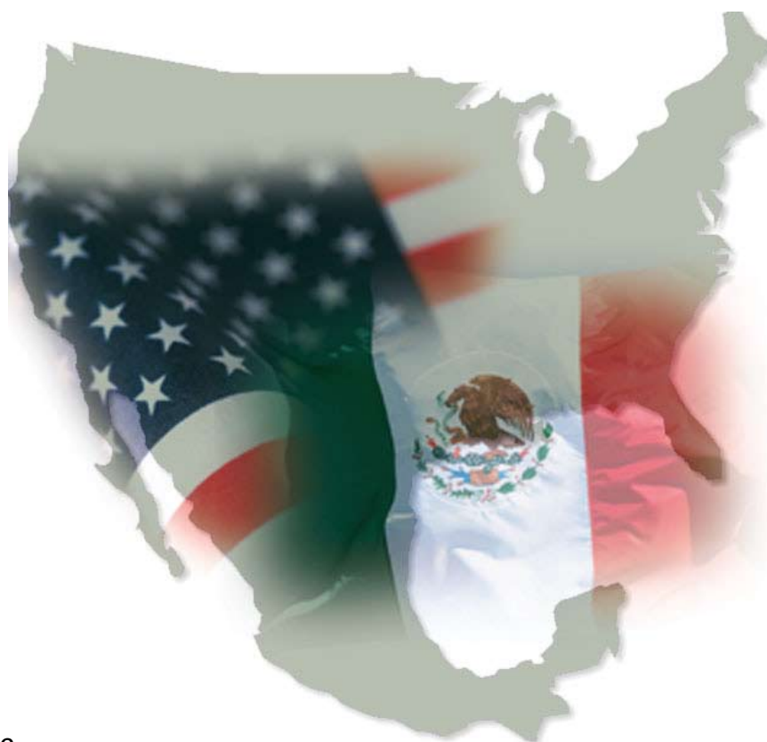
IMAGEN: MAGDALENA CONTRERAS